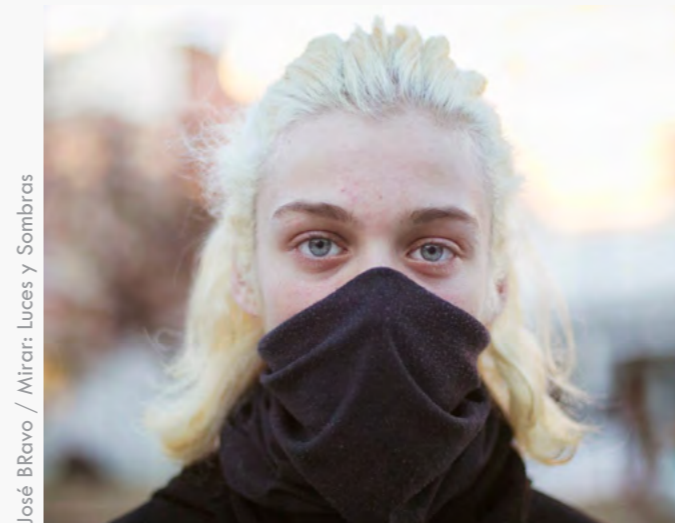
José Bravo / Mirar: Luces y Sombras