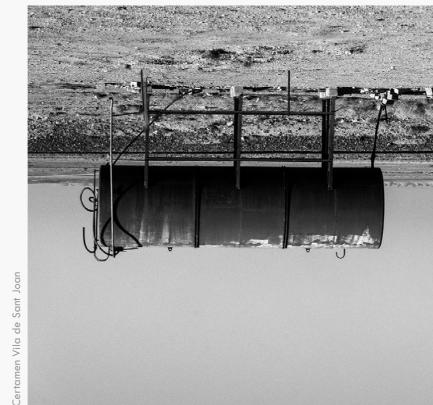
Certamen Vila de Sant Joan