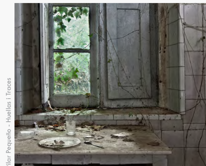
Pilar Pequeño - Huellas i Traces

Espacios de difusión de la fotografía contemporánea Centro Cultural Las Cigarreras 17.3.2018 / 20:30h